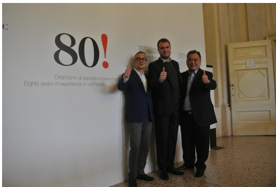
圖片三至四： Molteni Group 與尚家生活帶領傳媒專程往意大利米蘭參觀 Molteni & C 八十週年博物館。